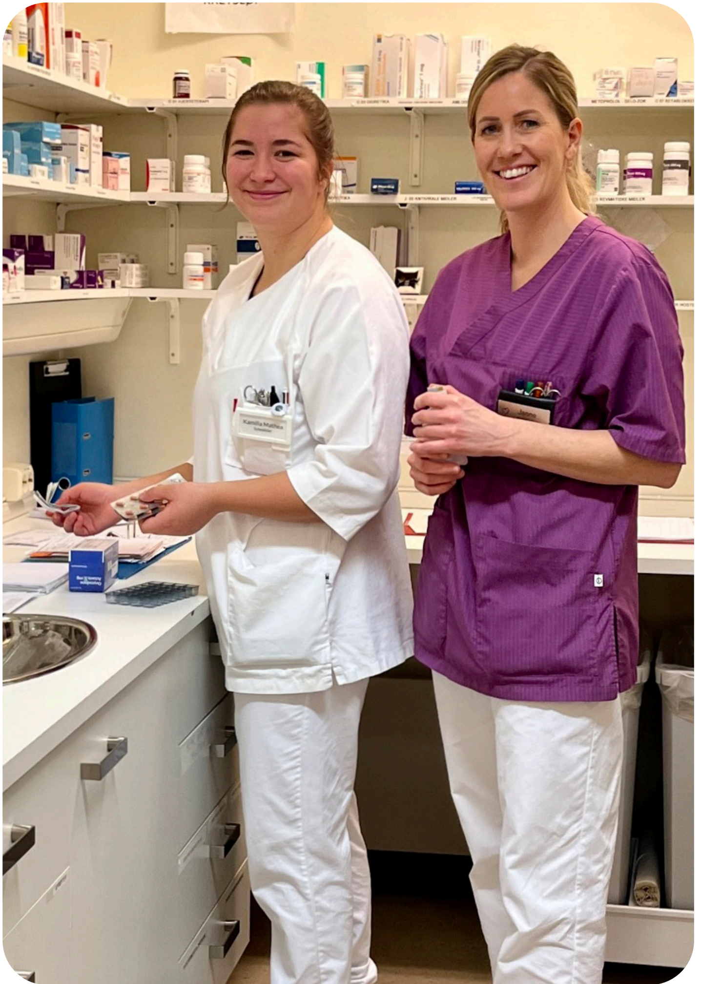
Sjukepleiarar på jobb på POS