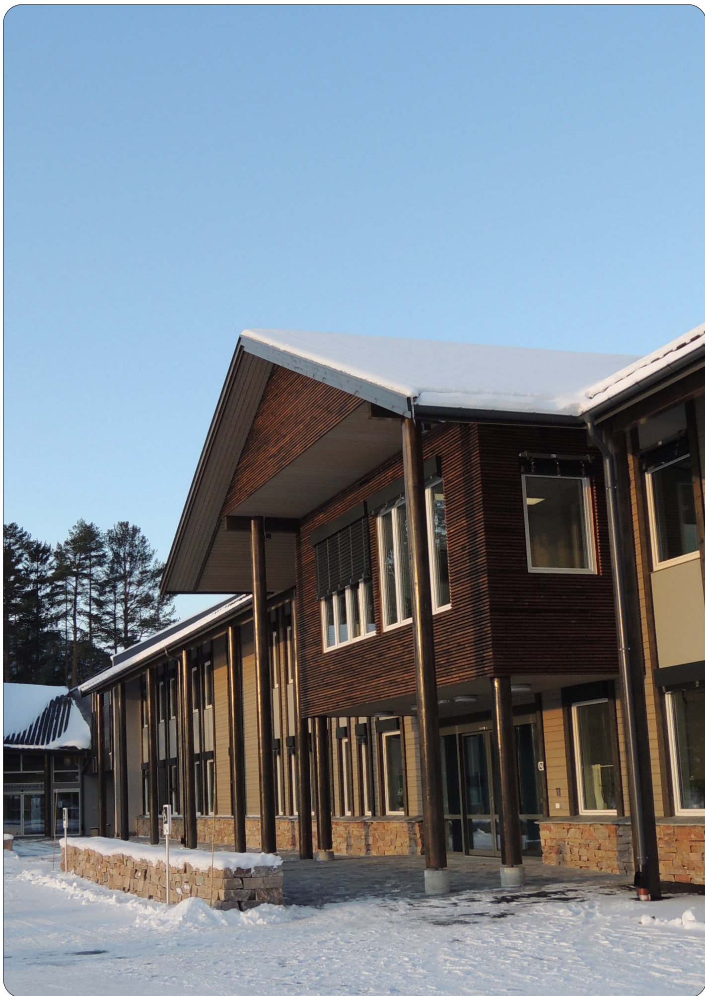
Fyresdal Næringshage husar kommuneadministrasjonen