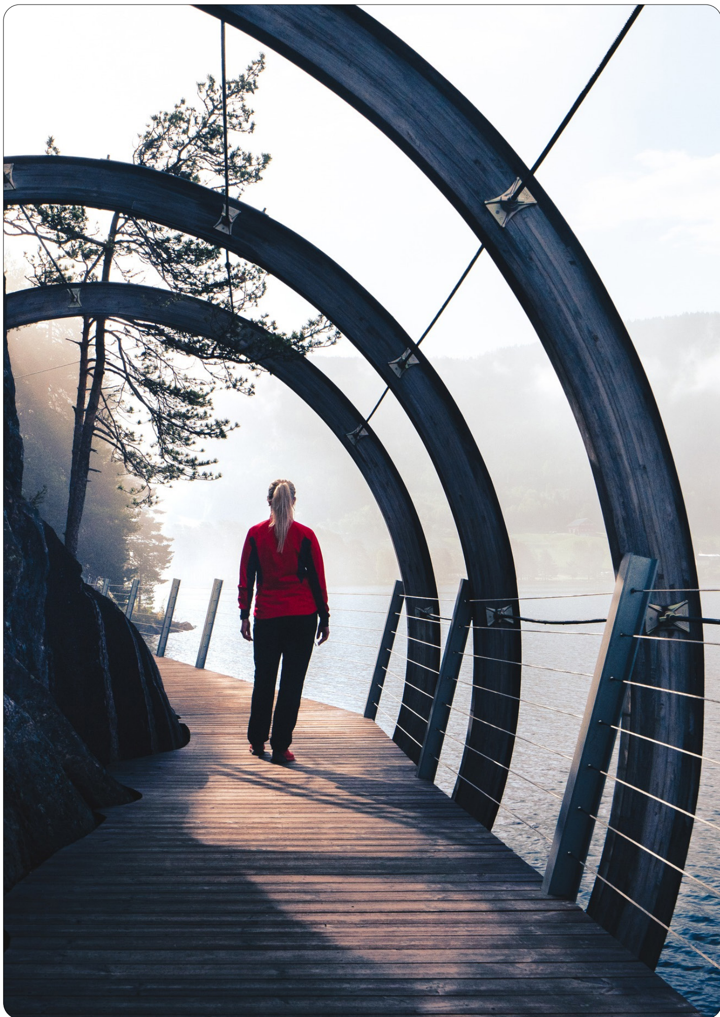
Utviklinga av Hamaren som nærmiljøanlegg og attraksjon er viktig for samfunnsutviklinga i Fyresdal