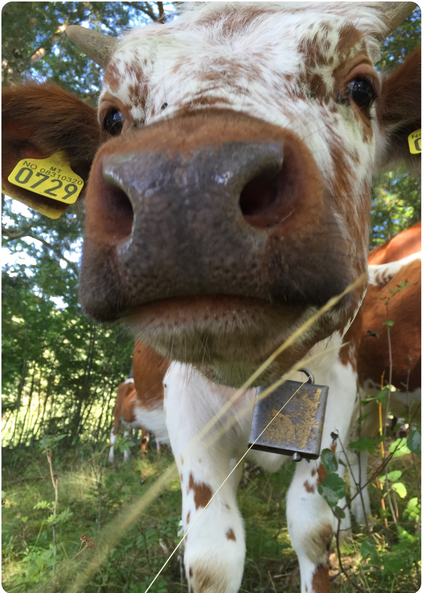
Telemarskyr frå Snarteland