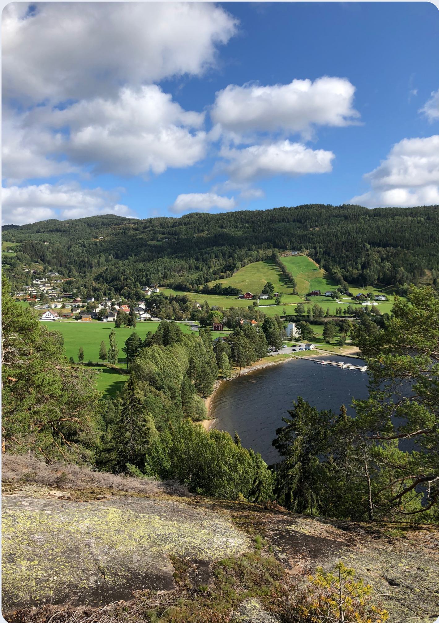
Fyresdal sentrum sett frå Klokkarhamaren