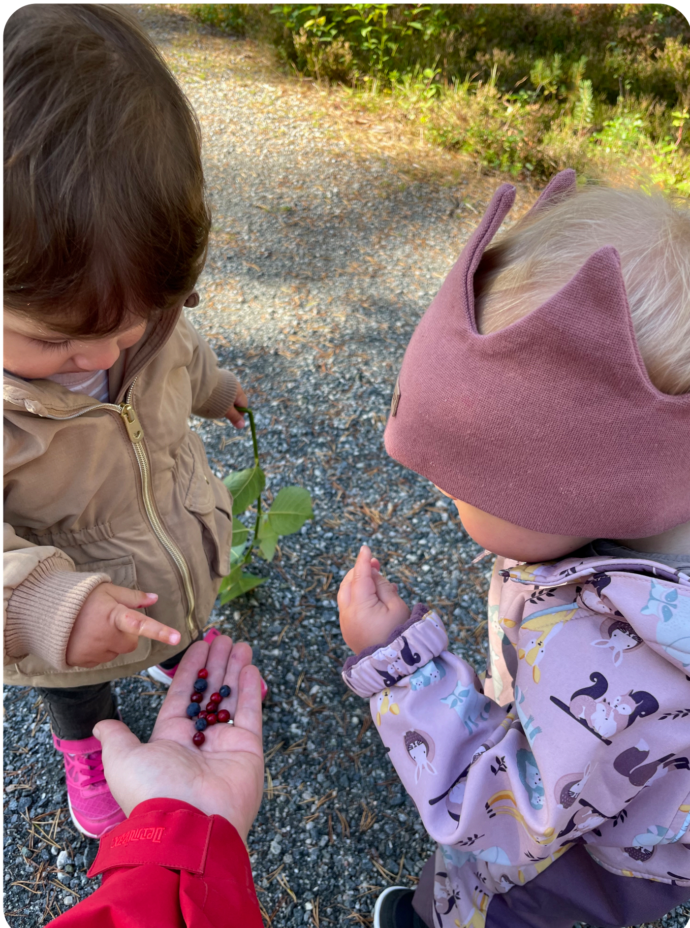
Opplæringa startar med dei minste barna i barnehagen